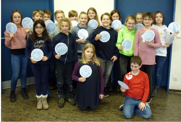
Orientierung am Nachthimmel kann man sich mit einer selbstgebauten Sternkarte verschaffen.