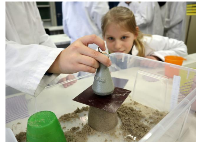
Welche Masse kann ein Turm aus Sand tragen?